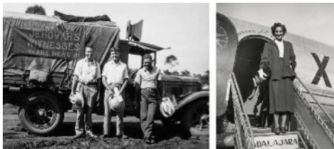
Participando en una gira de predicación en Australia (1937). Una graduada de Galaad llegando a su asignación en México (1947).

A lo largo de los años, muchos cristianos se han dado cuenta de que, si aprovechan las ventajas de la soltería, pueden ampliar su ministerio, hacer nuevos amigos y estrechar su relación con Jehová.