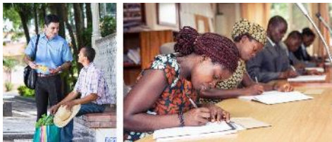
Predicando en Brasil. Asistiendo a la Escuela para Evangelizadores del Reino en Malauí.

PARA MEDITAR: ¿Cómo puede usted aprovechar sus circunstancias si es soltero?