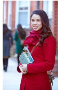
Las escuelas teocráticas benefician tanto a hermanos como a hermanas

Inscripción: Podrán inscribirse quienes estén en el servicio de tiempo completo, tengan entre 23 y 65 años, gocen de buena salud, cuenten con las circunstancias adecuadas para servir donde más se los necesite y tengan la actitud de Isaías, quien dijo: "¡Aquí estoy yo! Envíame a mí" (Is. 6:8). Todos los que asistan a la escuela, sean solteros o casados, deben haber servido de tiempo completo por dos años o más sin interrupción. Los matrimonios deben llevar al menos dos años casados. Los hermanos deben