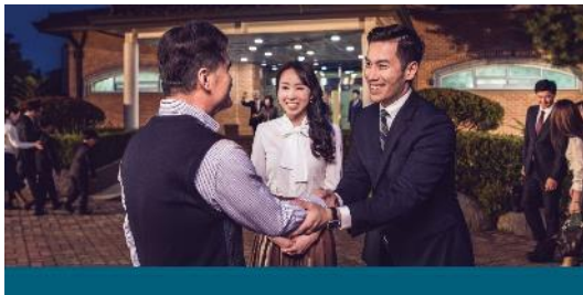
Dando la bienvenida a una persona que asiste por primera vez a la Conmemoración.