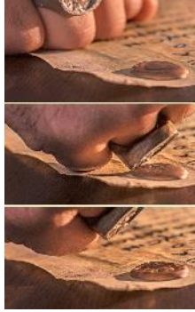
En la antigüedad, los documentos se validaban presionando un anillo de sellar en arcilla o cera.

La prenda. Según una obra de referencia, la palabra griega que se traduce “prenda” en 2 Corintios 1:22 es “una expresión técnica que se usa en el campo legal y comercial”. Significa “pago inicial, depósito, adelanto, compromiso de pago, que da validez a un contrato o sirve de anticipo en una compra y permite reclamarla legalmente”. Cuando un cristiano es ungido por el espíritu santo, recibe una “prenda”. Sin embargo, como dice 2 Corintios 5:1-5, obtiene su pago o recompensa total cuando se viste con un cuerpo incorruptible en los cielos. La inmortalidad es parte de esa recompensa (1 Cor. 15:48-54).