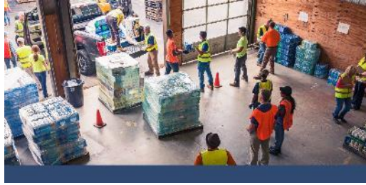
Labores de socorro en Estados Unidos.