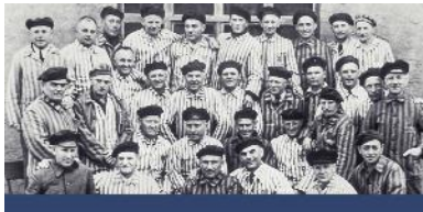
Un grupo de hermanos fieles liberados de un campo de concentración de Alemania (1945).