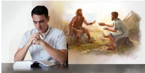
TESOROS DE LA BIBLIA | GÉNESIS 25, 26