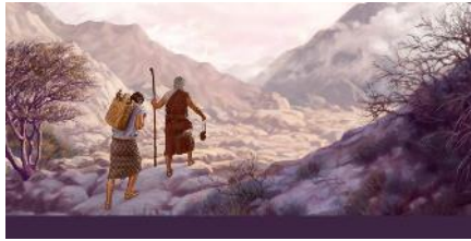
Abrahán dirigiéndose a la tierra de Moria con Isaac.