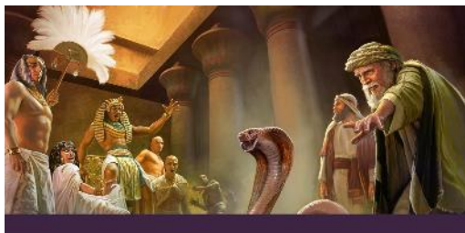
Moisés y Aarón haciendo un milagro delante del faraón.