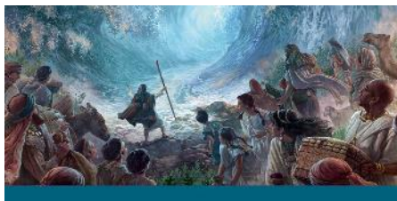
Moisés extendiendo los brazos para dividir el mar Rojo.