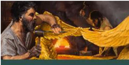
Bezalel y Oholiab haciendo los objetos del tabernáculo.