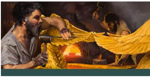
Bezalel y Oholiab haciendo los objetos del tabernáculo.