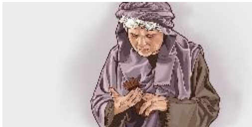
NUESTRA VIDA CRISTIANA