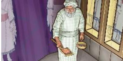
TESOROS DE LA BIBLIA | LEVÍTICO 16, 17