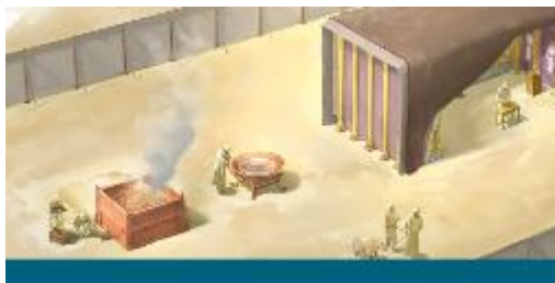
Los sacerdotes realizando sus labores en el tabernáculo.