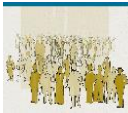
RECUADRO INFORMATIVO 10B: Los "huesos secos" y los "dos testigos" | La relación entre ambas visiones

14 ¿Qué cumplimiento mayor tuvo esta parte de la profecía de Ezequiel? En otra profecía relacionada, Jehová reveló mediante Ezequiel que el cumplimiento principal de esta profecía de restauración sucedería poco después de que Jesucristo —prefigurado por