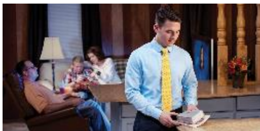
TESOROS DE LA BIBLIA