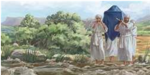
Los sacerdotes entran en el río Jordán con el Arca.