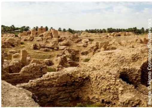
Las ruinas de Babilonia, en Irak