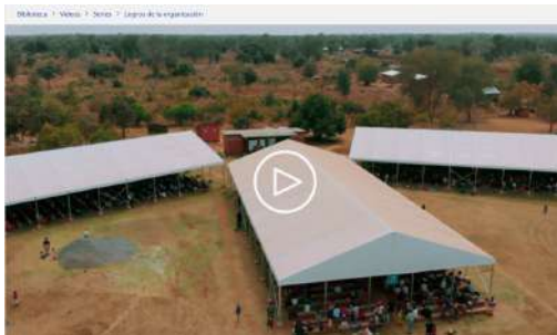
Logros de la organización: Jehová les demuestra su amor a los hermanos de África Duración: 8:02 https://download-a.akamaihd.net/files/media_periodical/1f/mwby_S_202205_03_r360P.mp4 (27MB)