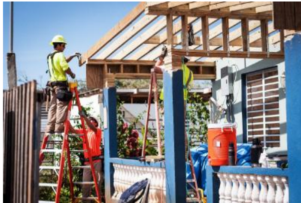
Algunos testigos de Jehová dan ayuda práctica a las víctimas de un huracán en Puerto Rico.

Dios usa a sus siervos para dar ayuda práctica a las víctimas de los desastres naturales (Hechos 11:28-30 28 Uno de ellos, llamado Ágabo,+ se levantó y profetizó mediante el espíritu que toda la tierra habitada estaba a punto de sufrir una época de mucha hambre,+ que de hecho tuvo lugar en tiempos de Claudio.+ 29 Así que los discípulos decidieron enviarles ayuda,+ cada uno según sus posibilidades,+ a los hermanos que vivían en Judea. 30 Y eso hicieron. Les enviaron la ayuda a los ancianos mediante Bernabé y Saulo.+; Gálatas 6:10 10 Por eso, mientras tengamos la oportunidad,* hagamos el bien a todos, pero especialmente a nuestros hermanos en la fe.).