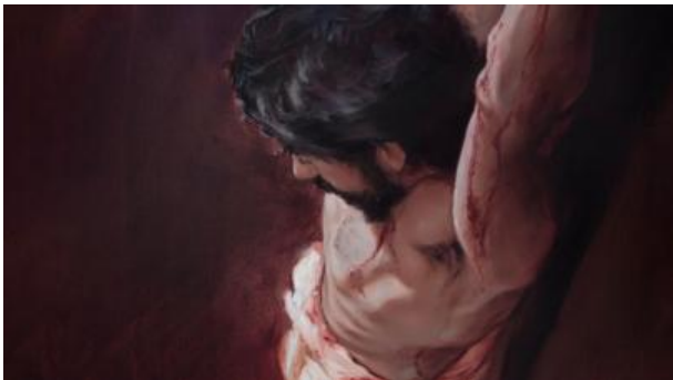
A Jehová le dolió mucho ver a su Hijo sufrir. (Vea el párrafo 8).

17 Por la fe, cuando Abrahán fue puesto a prueba,+ prácticamente ofreció a Isaac —así es, el hombre que de buena gana recibió las promesas intentó ofrecer a su hijo unigénito—,+ 18 aunque se le había dicho: “Por medio de Isaac vendrá lo que será llamado tu descendencia”.+ 19 Pero él llegó a la conclusión de que Dios podía levantarlo incluso de entre los muertos, y en efecto lo recibió de entre los muertos de manera simbólica.+